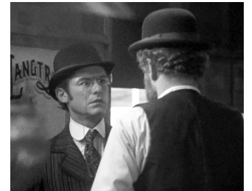
1972 JUGE ET HORS-LA-LOI (... Judge Roy Bean) de John Huston avec Paul Newman