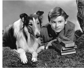
1943 LA FIDÈLE LASSIE (Lassie come home) de Fred M. Wilcox