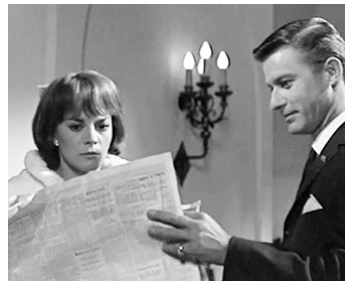
1965 DAISY CLOVER (Inside Daisy Clover) de Robert Mulligan avec Natalie Wood