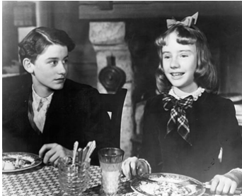
1944 LES CLEFS DU ROYAUME (The Keys of the Kingdom) de John M. Stahl avec Peggy Ann Garner