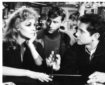
1960 LES RATS DE CAVES (The Subterraneans) de R. McDougall avec Janice Rule, Scott Marlowe