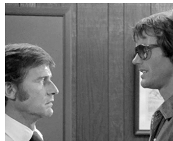
1974 LARRY LE DINGUE, MARY LA GARCE (Dirty Mary crazy Larry) de J. Hough avec Peter Fonda