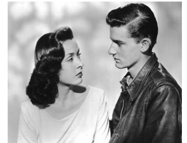
1948 LE PARI FATAL (Tuna Clipper) de William Beaudine avec Elena Verdugo