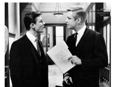
1965 LE TÉMOIN DU 3 e JOUR (The third Day) de Jack Smight avec George Peppard