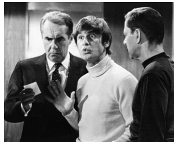
1968 HELLO DOWN THERE de Jack Arnold avec Jim Backus, Tony Randall