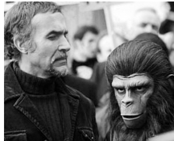
1972 LA CONQUÊTE DE LA PLANÈTE DES SINGES (Conquest...) de J. Lee Thompson avec R. Montalban