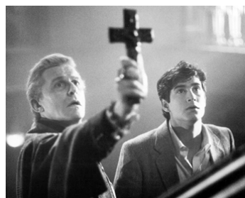
1985 VAMPIRE, VOUS AVEZ DIT VAMPIRE ? (Fright Night) de T. Holland avec W. Ragsdale