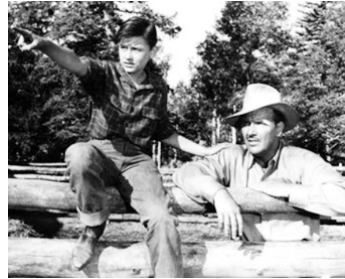
1943 MON AMIE FLICKA (My friend Flicka) d' Harold D. Schuster avec Preston Foster