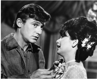
1966 L'HONORABLE GRIFFIN (The Adv. of Bullwhip Griffin) de James Neilson avec Suzanne Pleshette