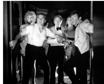
1972 L'AVENTURE DU POSÉIDON (The Poseidon Adv.) de R. Neame avec S. Stevens, R. Buttons