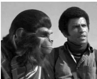
1973 LA BATAILLE DE LA PLANÈTE DES SINGES (The Battle...) de J. Lee Thompson avec A. Stocker