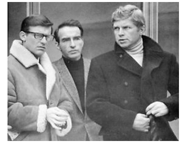
1966 L'ESPION (The Defector) de Raoul Lévy avec Montgomery Clift, Hardy Krüger