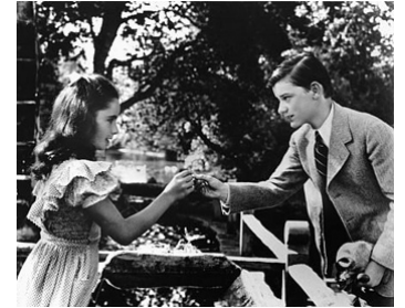
1944 LES BLANCHES FALAISES DE DOUVRES (The white cliffs of Dover) de C. Brown avec E. Taylor