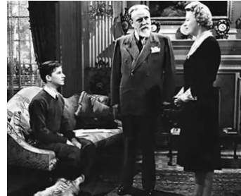
1945 MOLLY ET MOI (Molly and me) de Lewis Seiler avec Monty Wooley, Grace Fields