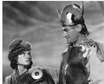
1947 MACBETH (Macbeth) d' Orson Welles avec John Dierkes