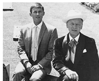
1964 LE CHER DISPARU (The Loved One) de Tony Richardson avec John Gielgud