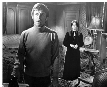
1973 LA MAISON DES DAMNÉS (The Legend of Hell House) de John Hough avec Gayle Hunnicutt