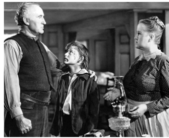
1941 QU'ELLE ÉTAIT VERTE MA VALLÉE (How green was my valley) de J. Ford avec D. Crisp, Sara Algood