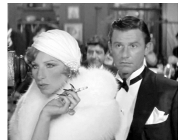
1974 FUNNY LADY (Funny Lady) d'Herbert Ross avec Barbra Streisand