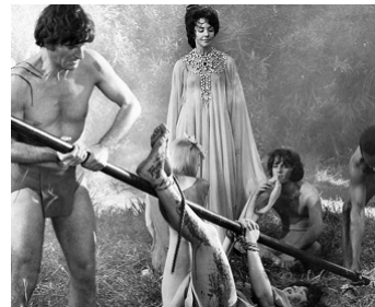
1969 LA CHUTE DES ANGES (Angel, angel, down we go) de Robert Thom avec Jennifer Jones