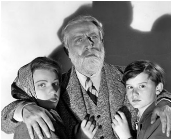
1942 ENFANTS EN EXIL (The Pied Piper) d' Irving Pichel avec Anne Baxter, Monty Wooley