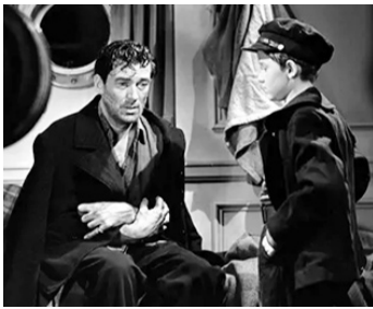
1940 CHASSE À L'HOMME (Man Hunt) de Fritz Lang avec Walter Pidgeon