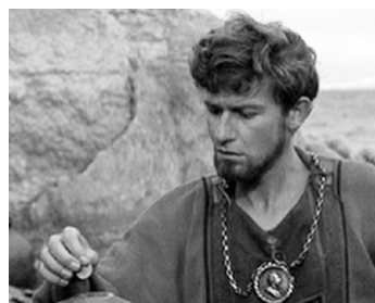
1964 LA PLUS GRANDE HISTOIRE JAMAIS CONTÉE (The greatest Story ever told) de George Stevens