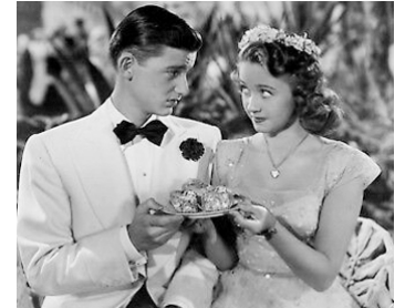
1946 FÉERIE À MEXICO (Holiday in Mexico) de George Sidney avec Jane Powell