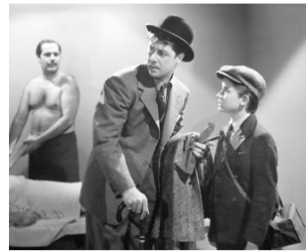
1941 CORRESPONDANT DE GUERRE (Confirm or deny) d' Archie Mayo avec Don Ameche