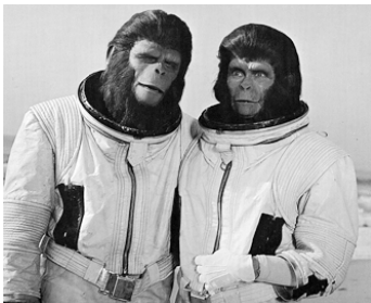
1970 LES ÉVADÉS DE LA PLANÈTE DES SINGES (Escape...) de J. Lee Thompson avec Kim Hunter