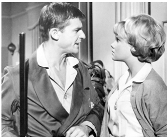
1965 L'ESPION AUX PATTES DE VELOURS (That Darn Cat) de R. Stevenson avec Hayley Mills