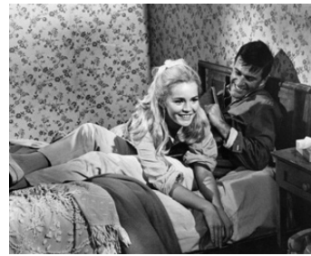
1965 LORD LOVE A DUCK de George Axelrod avec Tuesday Weld