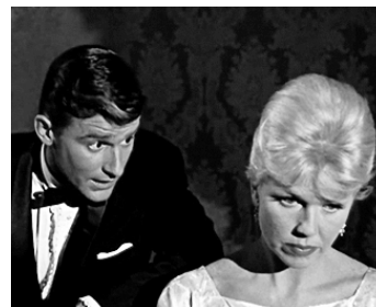
1960 PIÈGE À MINUIT (Midnight Lace) de David Miller avec Doris Day