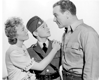
1944 JUPITER, LE FILS DE FLICKA (Thunderhead) de Louis King avec Rita Johnson, Preston Foster