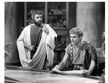
1963 CLÉOPÂTRE (Cleopatra) de Joseph L. Mankiewicz avec Andrew Keir