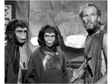
1967 LA PLANÈTE DES SINGES (Planet of the Apes) de F. Schaffner avec Kim Hunter, Charlton Heston