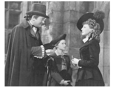
1941 LE CHEVALIER DE LA VENGEANCE (Son of Fury) de J. Cromwell avec G. Sanders, F. Farmer