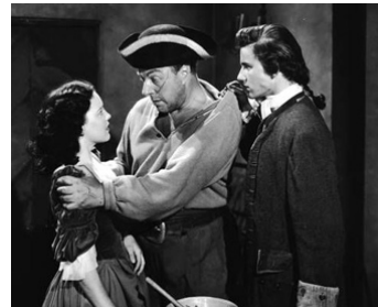
1948 CAPTIF EN MER (Kidnapped) de William Beaudine avec Sue England, Dan O'Herlihy